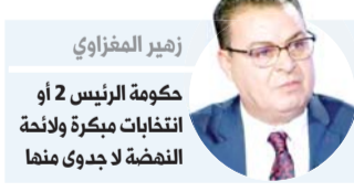
زهير المغزاوي حكومة الرئيس 2 أو انتخابات مبكرة ولائحة النفضة لاجدوى منفا

وقالت حركة النهضة في بيان الأربعاء إنها تتبنى "خيار سحب الثقة من السيد رئيس الحكومة إلياس الفخفاخ ويكلف رئيس الحركة راشد الغنوشي بمتابعة تنفيذ هذا الخيار بالتشاور مع مختلف الأحزاب والكتل والنواب بمجلس نواب الشعب".