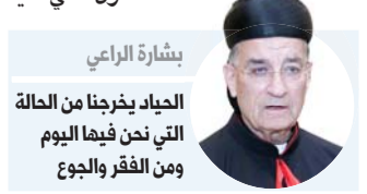
بشارة الراعي الحياد يخرجنا من الحالة التي نحن فيها اليوم ومن الفقر والجوع

من أجل توفير مساعدات للبنان في ظل المقاطعة العربية له من جهة والموقف الأميركي من حزب الله من جهة أخرى. وأوضح هذا المسؤول أن الراعي لم يحصل من عون على جواب واضح باستثناء أن على البطريرك التوقف في المرحلة الراهنة عن استفزاز حزب الله. على صعيد آخر أعلن في بيروت عن قيام "الجبهة الوطنية المدنية" التي تضم شخصيات من كل الطوائف تدعو إلى الانتهاء من نظام المحاصصة بين كبار السياسيين المعمول به، وإلى تشكيل حكومة جديدة برئاسة شخصية