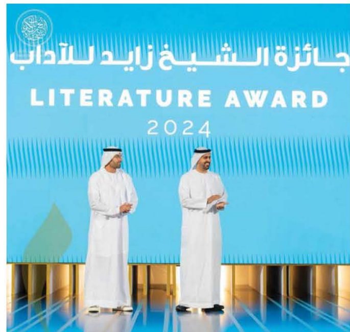
الجائزة تتويج سنوي لأهم الفاعلين الثقافيين

النقدية» و«الثقافة العربية في اللغات الأخرى» و«تحقيق المخطوطات»، وضمت القوائم أعمالا مميزة ومتنوعة من مختلف أنحاء العالم. واعتمدت الهيئة العلمية للجائزة والقوائم القصيرة، خلال اجتماع