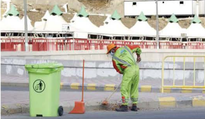
معاناة في بلادهم وفي المهجر

إلى دكا للعمل حارس أمن بعد أن دمرت الرياح الموسمية في العام الماضي محاصيل أسرته ومصابيد الأسماك. وأوضح لمؤسسة تومسون رويترز أن "الخسائر المتكررة الناجمة عن الكوارث صغبت البقاء على قيد الحياة هنا خلال السنوات الأخيرة. ويمكنك على الأقل كسب دخل ثابت بمجرد العثور على وظيفة في مدينة مثل دكا." ومع ذلك، فإن العديد من الذين يغادرون مدنها يواجهون مخاطر وصعوبات جديدة في بيئاتهم الجديدة، وخاصة أولئك الذين يهاجرون إلى الخارج.