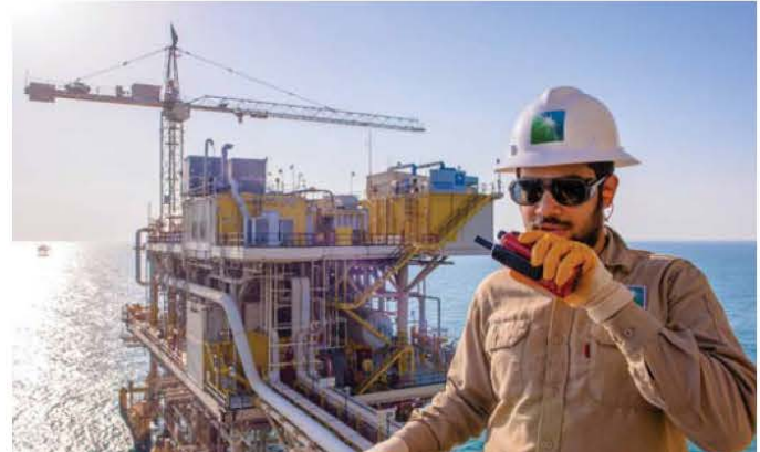
ألو.. كم تتوقع الأرباح.. حول

وتتوقع أرامكو الإعلان عن توزيعات أرباح الربع الرابع من العام الماضي، وهي مدفوعات تعد مصدرا أساسيا لإيرادات الدولة، بقيمة 31.1 مليار دولار، وهو نفس