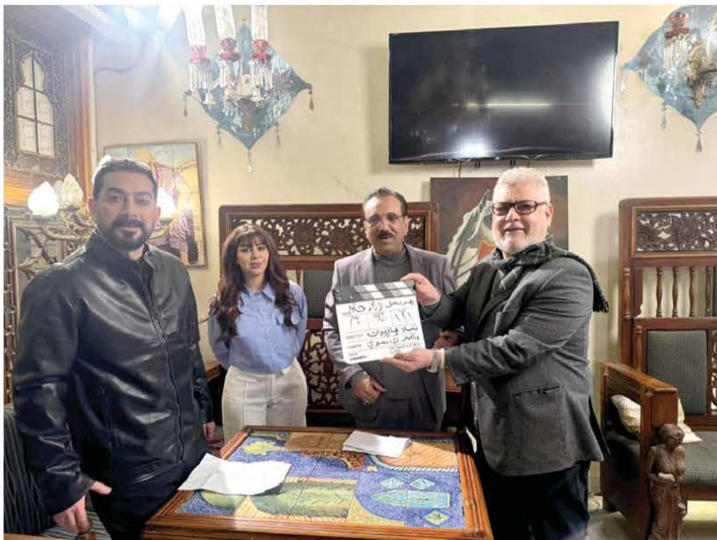
مواضيع متنوعة في الموسم الرمضاني

ناشطون: حال الدراما يعكس الواقع المتردي في شتى المجالات