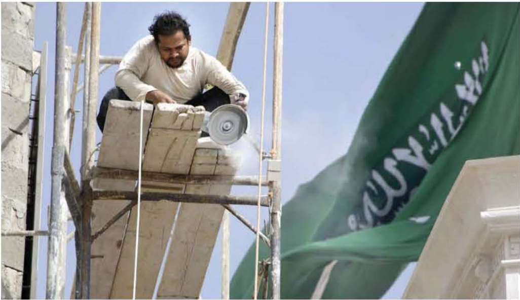
شقاء تحت الشمس