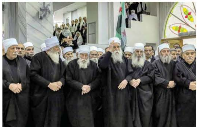
مدينة «الرجال الأشداء»

لم يكن أصحاب أكثر السيناريوهات تفاؤلا يتصورون أن تمر المرحلة الانتقالية في سوريا ببطل هذا الهوء، وبأقل حجم من الخسائر وردود الفعل. في بلد طالما نظر إليه العالم على أنه بقعة متخربة لما يحويه من طوائف وأقليات، العيون كلها اتجهت إلى منطقة الساحل السوري حيث التواجد المكثف للطائفة العلوية. ما حدث هناك كان مفاجأة للجميع. الحوادث القليلة التي جرت سارع وجهاء الطائفة العلوية وشيوخها إلى تطويقها منذرين بمن يقفون خلفها، مؤكدين دعمهم للحكومة الانتقالية. ما حدث مؤخرا في مدينة جرمانا ذات الغلبية الدرزية وادى إلى مقتل شخص وإصابة تسعة أشخاص آخرين، لا يختلف في دلالاته عن حوادث مشابهة جرت في الساحل السوري وتم تطويقها. الاختلاف كان في تدخل إسرائيل على الخط معلنة أنها ستوفر الحماية للطائفة الدرزية. دموع التماسيح وسعي إسرائيل لاستمالة الدروز في سوريا، لم ينجح.