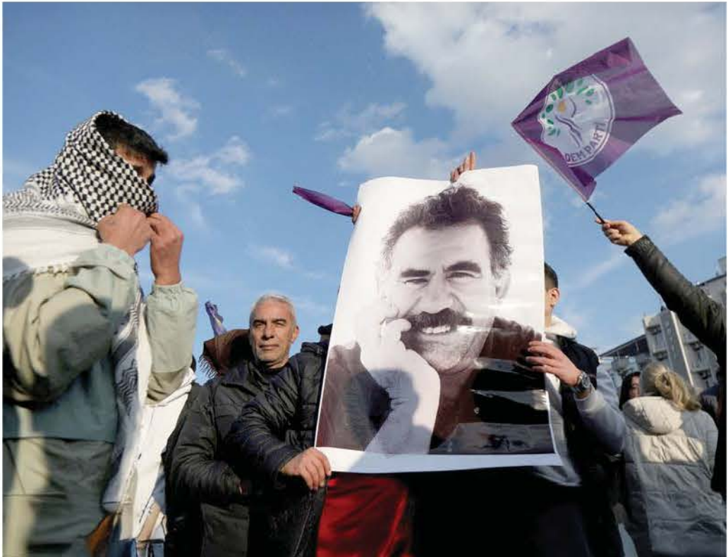
نداء تاريخي يتردد صدها في المنطقة

وارتفعت آمالهم بعد أن أعلن حزب العمال الكردستاني السبت الماضي وقف