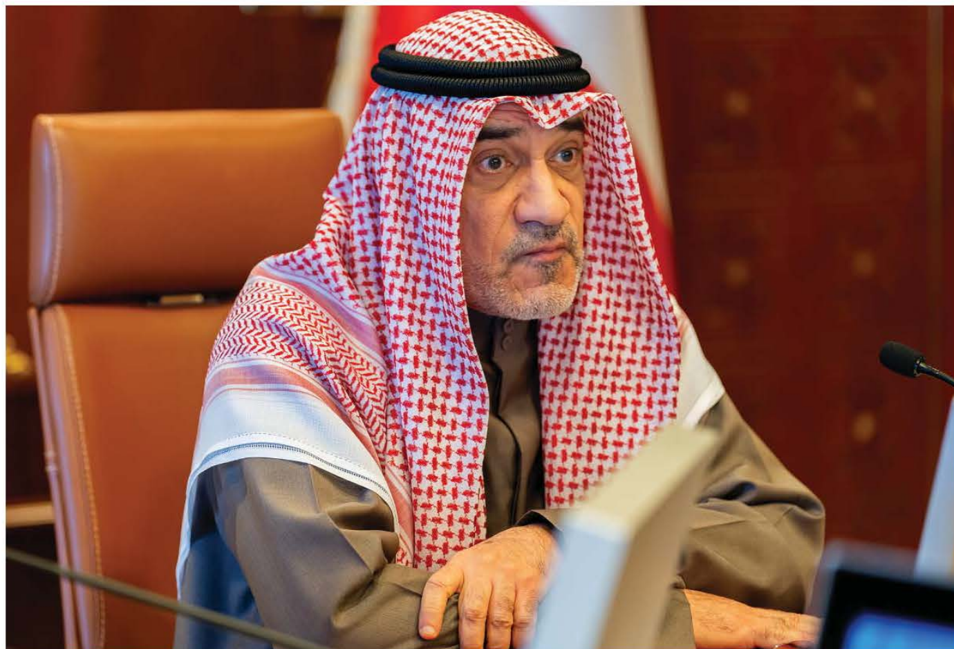
الصرامة عنوان المرحلة

لا أحد فوق القانون وملفات وزراء ونواب ورجال قضاء ومشاهير قيد التدقيق