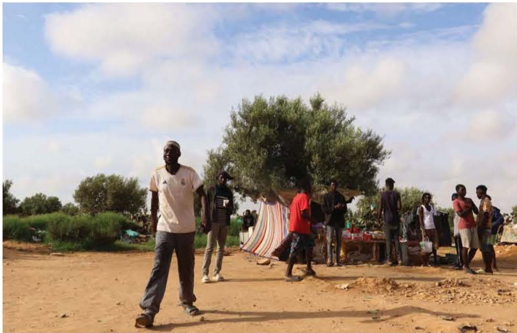
انتشار للمهاجرين في غابات الزيتون

مطالب بمنع منح الجنسية التونسية للمهاجرين المقيمين بصفة غير شرعية