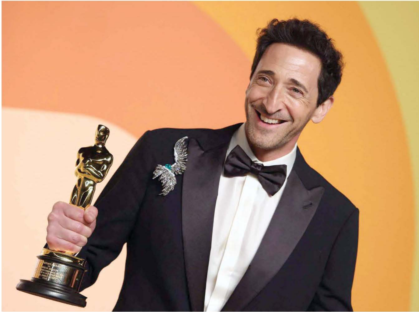
ممثل أبدع في أداء دوره

قصة مهندس مجري ينجو من النازيين ليواجه واقعا مجهولا في أرض الأحلام