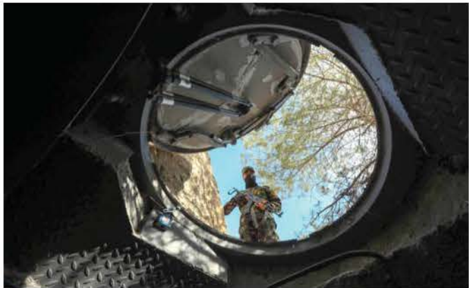
نظرة على أحد الجوانب المظلمة للفرقة الرابعة

ويشير الحارس إلى مكتب، يقول إنه "المكتب الأساسي" لـماهر الأسد، مؤلف من "طابقين فوق الأرض وتحته اتفاق تضم (...) غرفا مغلقة لا يمكن فتحها".