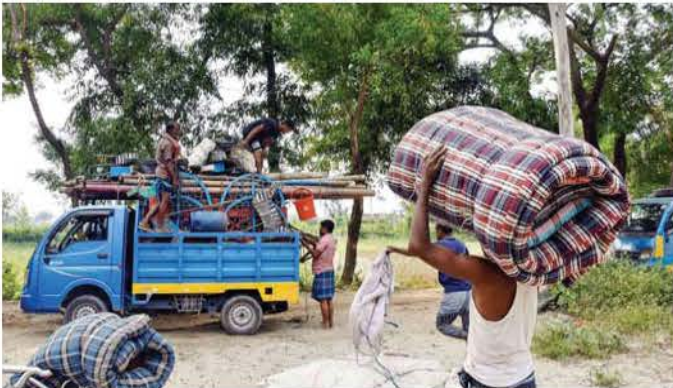
لا مفر من العناء