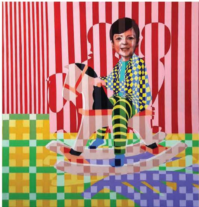
أسئلة الطفولة تكشف الحقائق (لوحة للفنان فادي عطورة)

ويتابع «أخذ قطار المنفى في البداية إلى براغ وفيينا، ثم إلى زيورخ، ومنها إلى الدمارك حيث عاش عدة سنوات. ولأنه كان يخشى أن يحتل الجيش الألماني الدمارك (وهو ما حدث لاحقاً)، واصل الرحيل إلى السويد في ربيع 1939، ثم إلى فنلندا. وفي عام 1941 حصل على تأشيرة دخول إلى الولايات