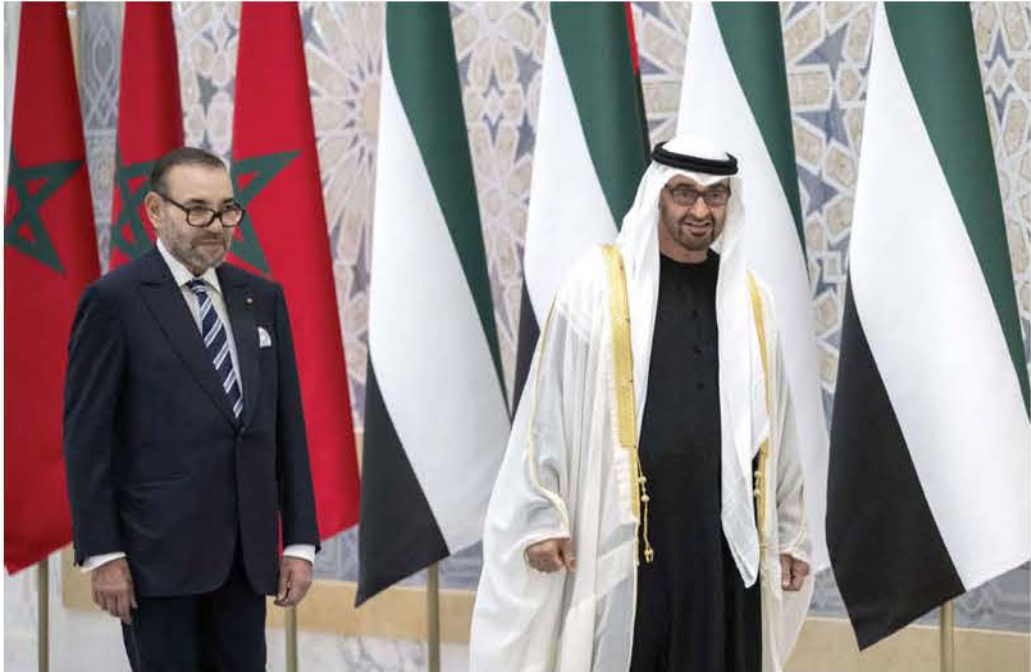
علاقات تاريخية تجمع بين المغرب والإمارات

السيادي الموريتاني لصالح جبهة بوليساريو الإرهابية، وتفرض وصاية حقيقية على علاقات نواكشوط بدول الجوار، وتكبل حرية موريتانيا كدولة ذات سيادة في تدبير علاقاتها الثنائية بالندية اللازمة مع باقي شركائها الإستراتيجيين كالمغرب والجزائر. انفتاح موريتانيا على محيطها الإقليمي هو أمر مطلوب من أجل بناء اقتصاد موريتاني تنافسي وقوي قادر على أن يكون أحد محركات قنوات التكامل الإقليمي بشكل متناغم مع المبادرات المغربية في أفريقيا. الرؤية الملكية الإستراتيجية تشكل العمود الفقري للسياسة المغربية في أفريقيا والمبادرات التنموية المغربية في أفريقيا، وبشكل خاص في غرب أفريقيا والساحل، حيث تعتبر أرضية مشتركة صلبة يمكن الاعتماد عليها لتطوير العمل البيني المشترك والتعاون الإقليمي بين الرباط وأبوظبي ونواكشوط في ظل التحديات الجيوسياسية الدولية والقارية والإقليمية التي يعرفها العالم. تتطلب هذه التحديات المزيد من تشبيك العلاقات الاشتراكي وهيمنة الفكر الانقلابي على القيم الديمقراطية الأصيلة. اتفاقية الجزائر 1979 ترهن القرار