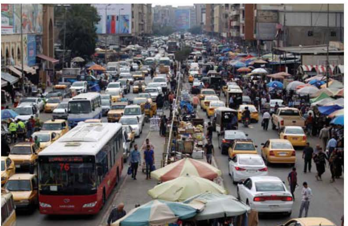
سباق بين نمو أعداد السيارات والبنية التحتية

وبينما تعمل السلطات منذ أشهر على تطوير البنية التحتية للطرق ضمن خطة هدفها مواجهة تسهيل حركة النقل، أعلنت وزارة التجارة الاثنين، أنها بصدد وضع محددات لاستيراد المركبات خلال الفترة المقبلة.