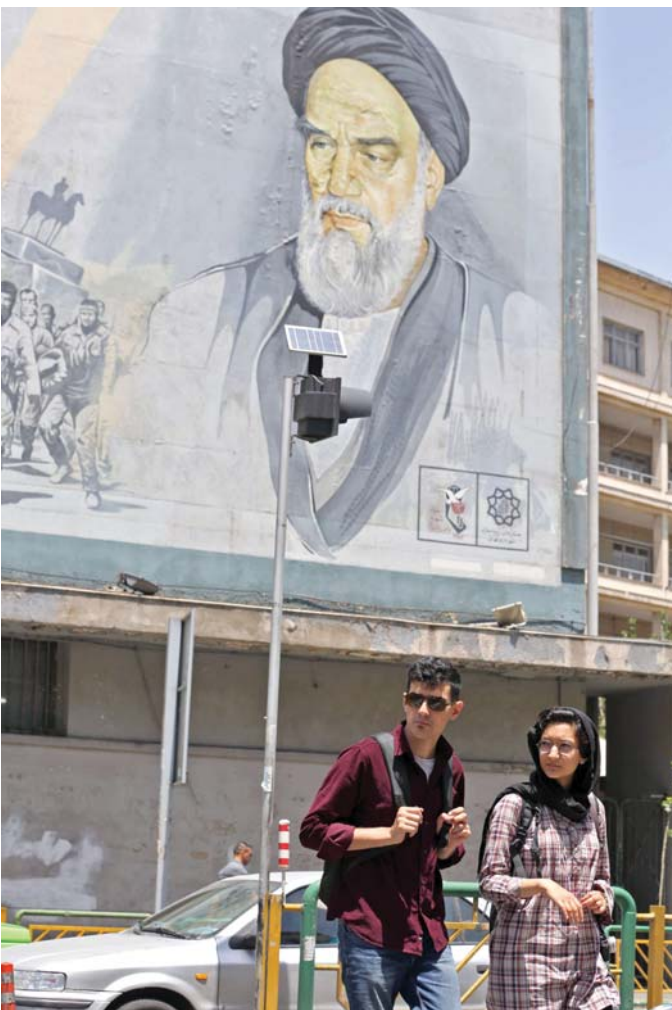
الشباب يدير ظهره لمبادئ ثورة لم يعرف منها غير القمع والعزلة

لا يزال آية الله الخميني مرجعاً رئيسياً في إيران حيث تسترشد المؤسسات التي ساهم في إنشائها