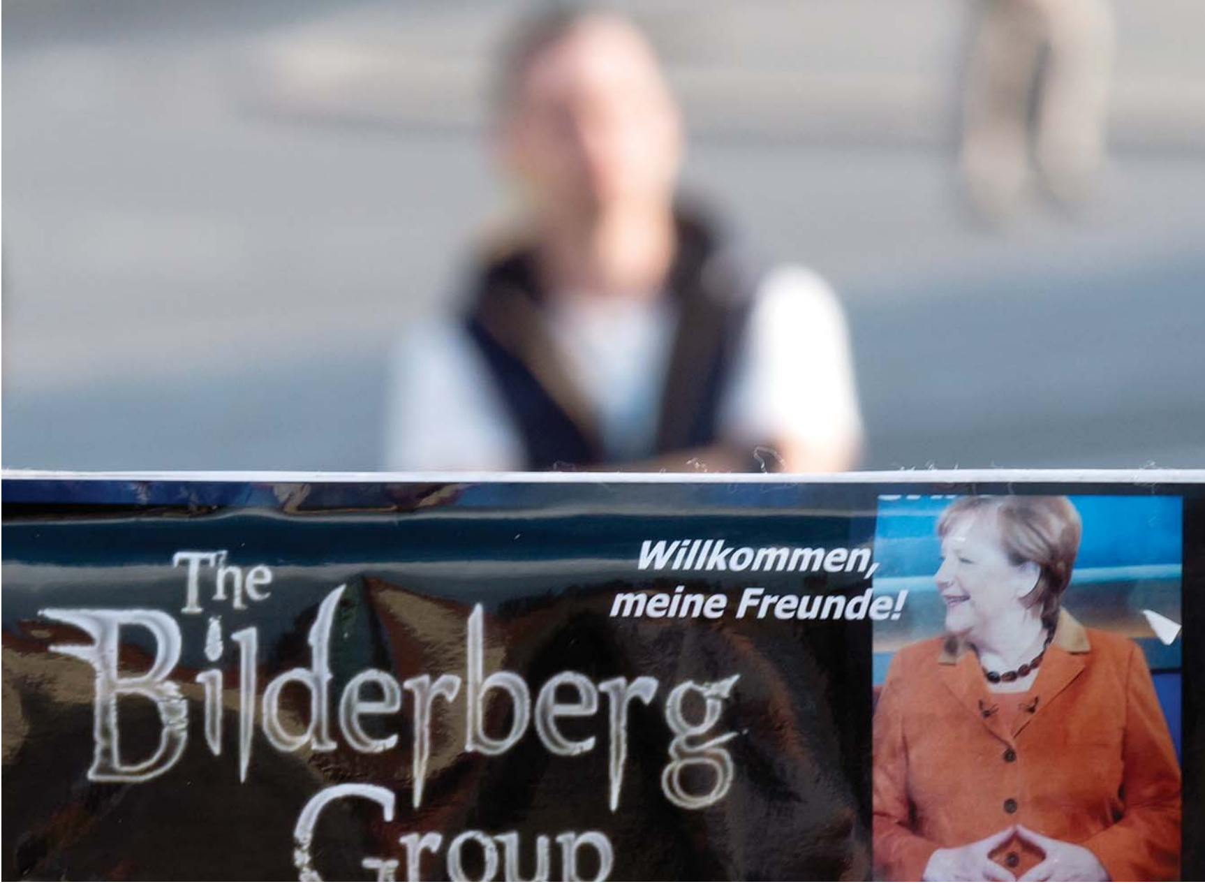
مؤتمرات بيلدريبرغ السنوية.. عقل العالم

في المقابل، لا يرى العديد من الأفراد خطورة أو أهمية في المؤتمر، مثلاً حضر الفيلسوف والكاتب الكندي مارشال ماكلوهان (1911-1980) هذا المؤتمر سنة 1969. ووصفه بأنه اجتماع لـ"عقول من القرن التاسع عشر تتظاهر بانتماؤها إلى القرن العشرين". وقال إن المواضيع المتناولة كانت تافهة.