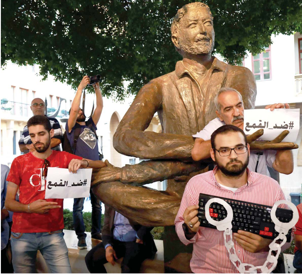
الأغلال لن تمنع إيصال الكلمة الحرة