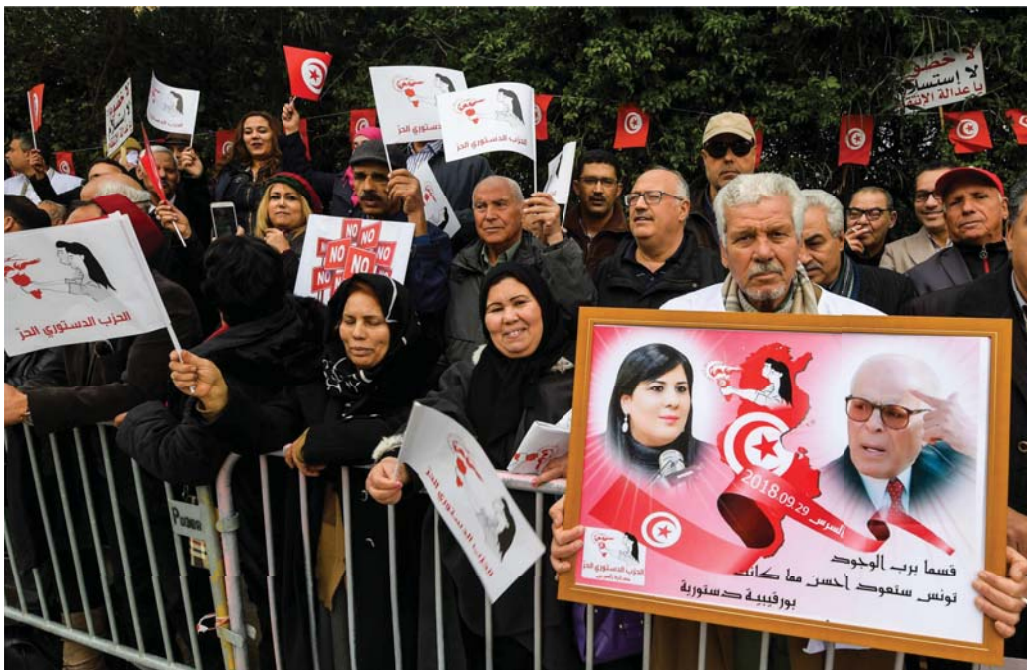
الخطابات الشعبية تنجح في استمالة الناخب

كل الدلائل تشير إلى أن تونس بصدد طي حقبة سياسية امتدت نحو عقد منذ بداية الانتقال السياسي عام 2011، لكن لا أحد يعلم تحديدا أي طريق ستسلك الديمقراطية الناشئة بعد انتخابات 2019. استطلاعات الرأي الدورية، حتى مع احتساب الحد الأقصى من هامش الخطأ، تؤكد هذا المنحى وتعطي انطباعا قبيلا أشهر قليلة من الانتخابات بأن البلاد تتجه إلى منعرج آخر، يصعب معه