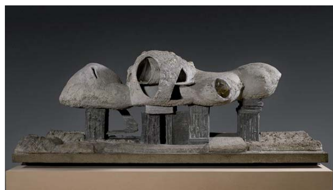
منازل مستوحاة من بيت الإنسان الأول

أما مغامرة إيجاد الكهف المناسب للاستقرار ففراها في أعمال التجهيز التي أنجزها المهندس المعماري كريستيان كيريز بعنوان «فضاءات غرضية»، وهي عبارة عن كتل ضخمة من مواد اصطناعية، تتيح للزائر تسلقها واكتشافها والتحرك ضمنها، ما يترك له حرية ارتجال الوظيفة التي يمكن أن يشغلها كل جزء منها، فهي ليست مساحات مفتوحة ولا مساحات مسيكة الصنع، بل فضاء يتحرك للزائر حرية تلمس العمارة بالمعنى الحرفي واكتشاف الاحتمالات التي لا تظهر عادة في الفضاءات المصممة مسبقاً.