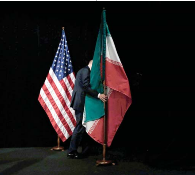
إيران إلى الورا

وصمودهم، وإصرارهم على مواجهته بكل الوسائل المتاحة، وقم مكة على ذلك أكبر دليل. إن هذا هو منطلق التاريخ الذي لم يتبدل، ولن يتبدل، إلى أبد الأبد.