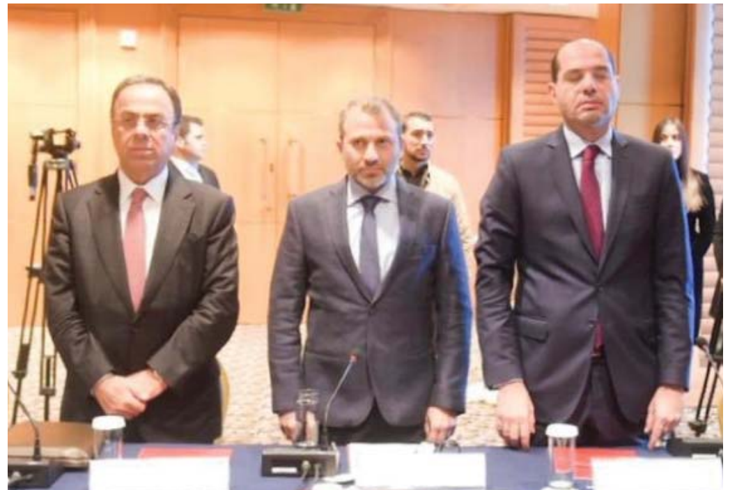
ورقة باسيل الاقتصادية تضمنت أفكارا أطالت من «عمر» النقاشات وبالتالي تأخر إقرار الموازنة في مجلس الوزراء، وبدأ بطيش أثناءها مستمعا فقط.